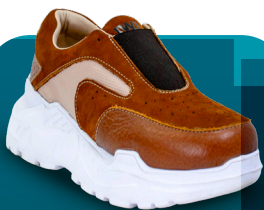
DBM 011 Deportivo | Mujer 36-37