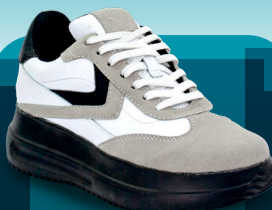
DBM 012 Deportivo | Mujer 36-37