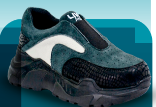
DBM 014 Deportivo | Mujer 36-37