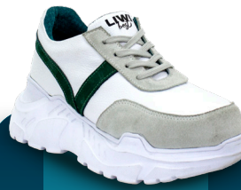
DBM 010 Deportivo | Mujer 36-37