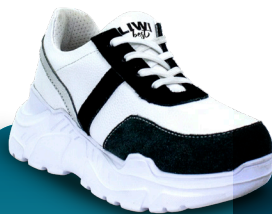
DBM 010 Deportivo | Mujer 36-37

LIWI Best Esencial nace de entender que las mujeres modernas no eligen entre verse bien y sentirse bien. Quieren ambas. Y las merecen.