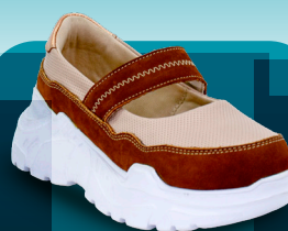
DBM 013 Deportivo | Mujer 36-37