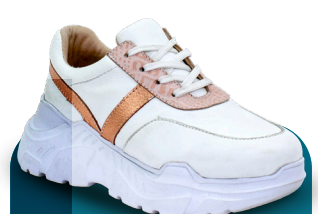
DBM 010 Deportivo | Mujer 36-37